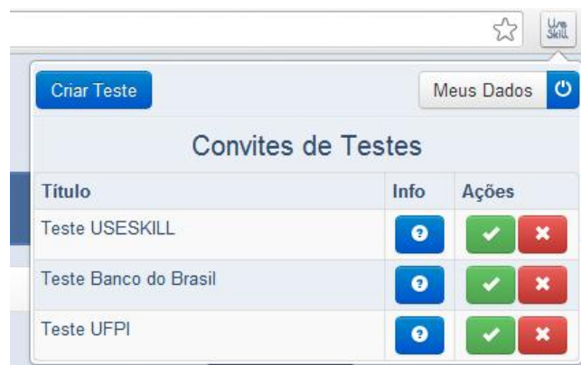
Figura 2 Plug-in da ferramenta responsável pela Captura de Ações.

O módulo de Gerenciamento dos testes foi desenvolvido utilizando a tecnologia Java Web, usando como frameworks Vraprot e Hibernate com Jpa. Ele é responsável pelo armazenamento e gerenciamento de todas as informações dos testes que são realizados.